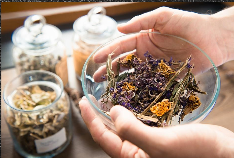
График занятий очень плотный и предполагает проведение экзамена и подготовку квалифицированных интернов по фитотерапии