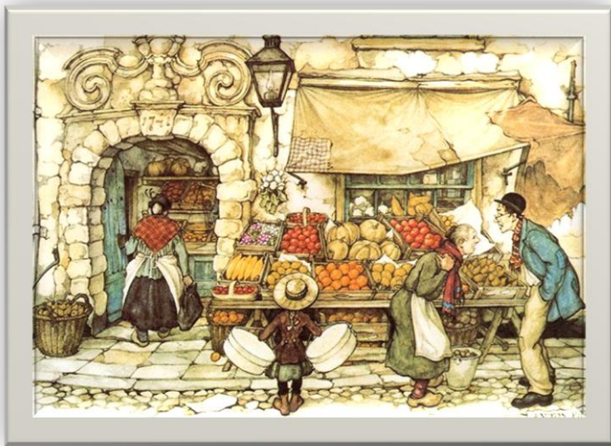
Овощная лавка матушки Друдль

Наша «Лавка таинственных трав» существует сразу в двух временах и измерениях.