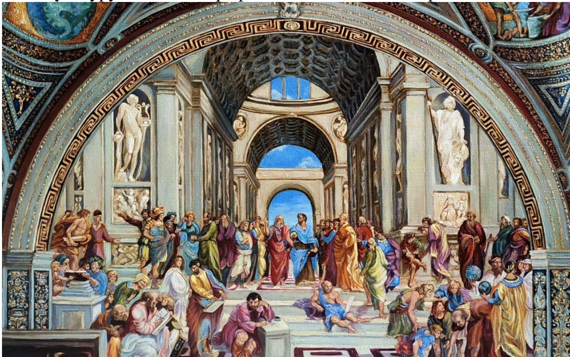
Рафаэль. Афинская школа

После Моисея уже в Греции траволечение развивали вначале Орфей, затем Пифагор и Платон, а основываясь на их знаниях и Гиппократ, развили и углубили культуру лечения и профилактики отдельными растениями.